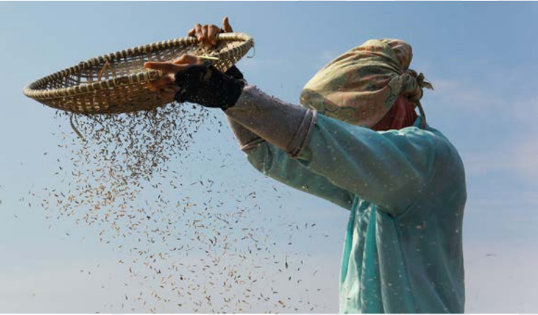
Asya Kitası'nın kırsal bölgesinde çalışan kadın çiftçi pirinç elerken

Kendi tarım işletmesinde asgari yaşam standartlarının altında, az topraklı veya topraksız aileler ile kentlerdeki işsiz ve yoksul aileler geçimlerini sağlayabilmek ve hayatta kalabilmek amacıyla, daha fazla tarımsal iş olanağı bulunan yörelere giderek mevsimlik işgücü olarak çalışmaktadırlar. Bu aileler, düzenli gelir getiren başka işleri olmadığı için, en kolay ulaşılabildikleri iş olan tarım işçiliğini yapmaktadırlar. Mevsimlik tarım işçisi aileler, sosyal destek yokluğunda ve yoksulluk döngüsünden kurtulamadığı için çocuklarını da yanlarında götürerek tarım işçisi olarak çalıştırmaktadırlar. Türkiye İstatistik Kurumu (2019) verilerine göre, mevsimlik kadın işçilerin günlük ücretleri 79 lira, erkek işçilerin ücretleri ise 94 lira olarak açıklanmıştır.