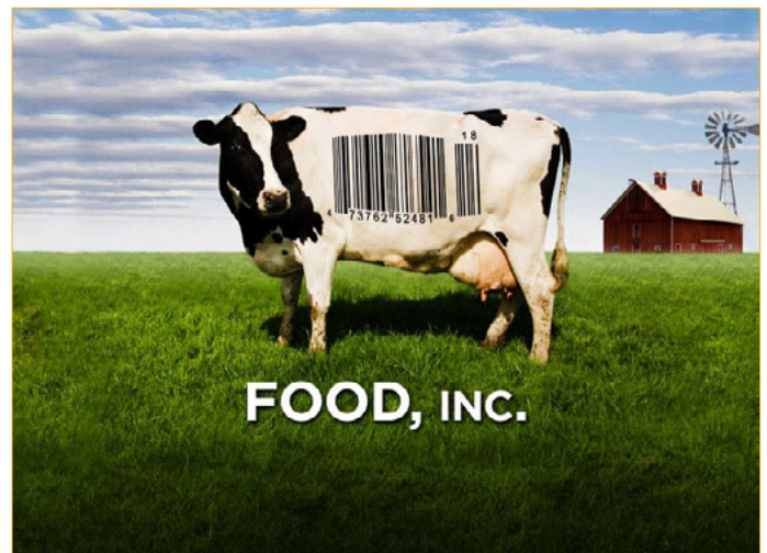
Wêne: Ji afîşa belgefilma "Food, Inc" (Gıda A.Ş) hatiye girtin.

Têgiha rejîma xwirekan, derfeta bi hêsani fêmkirina têtikiliyên tevlihev ên pergala xwirekan a kurewî ya neolîberal a bi awayên hegemonyaya cuda pêşkêşî me dike. Di berdewamiya sedsala dawîn de mezimbûna bazirganiya çandiniya cihanê, bilindbûna hinardeya emtia ya çandiniya ji nîveka sedsala 19'an ji çend milyon tonî, di serê sedsala 21'an de gihîştina 1.4 milyar tonî, meziniya daneheva sermayeyê nîşan dide. Di pergala xwirekan a neolîberal de, çawanî û taybetiyên herikîna bazirganiyê, bikaranîna zeviyên, berhemdariya zaviyan û ya girîng awayê hilberîn û mezaxtina çandiniyê, ji bo dahûrandina awayê çêbûna rejîma xwirekan a neteweyî pîvanên bingehîn in. Roja me ya îro rejîma xwirekan hegemonyaya xwe çawa ava kir û di çandiniyê de hilberîn û mezaxtin çawa ji aliyê şirketan ve têt diyarkirin, em ê hem ji aliyê çandanî hem jî ji aliyê çawaniyê ve hewl bidin rave bikin.