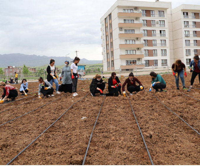
Wêne: Şaredariya Silopiyayê bi giştî

Di dema pêvajoya pandemîna Covid-19'ê de şaredarî li dijî xela û krîza xwirekan, ji bo şênîyên Silopiyayê pirsgirêkan nejin ke-tiye nav seferberiyê. Hele di pêvajoya ku nexweşî em dorpêç-kirin de em xebatên şaredariyê bêyî cudahî têxe nav mirovan hewl didin xwirekên erzan û bi tendurist bigihînin gel, girîng dibînin. Gelê me li cihê xwarina xwirekên çavkaniyên wê nizanin, bi xwarina berhemên xwirekên bi faliyeta Şaredariya Silopiyayê hatine hilberandin bi awayekî tendurist û xwezayî dê xweyî bibin.