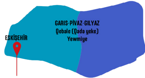
Fotograf u Agahi: Atolyeya Peşketine

U Eskişehire di hilberina pivazen hişk de rebaza heqdestiya li serî kiloyan, di palehiya gilyazan de rebaza yewmiye, di garisen heandi de ji li beramberî hilberine heqdestiya yewmiyeye te pekanin. Di dema pevajoja hilberandina pivaze hişk de hem ii ferden malbatên ku dikarin kar bikin, tev li dibin, ji ber ve yeke tevlibiina temene xebitandina zarokan dadikeve heta 5-6 saliyên.