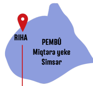
Fotograf u Agahi: Atolyeya Peşketine

Hilberina titiine gelemperî wek pargidaniya malbatî te kirin. Zarok ji di temene bifîk de bi malbate xwe re tev li hilberina titiine dibin. Berhevkirina pelen titiine dive yan bi şev an ji sere sibe zî were kirin. Ji ber ve yeke zarok ji bi şev tev li berhevkirina titiine dibin.